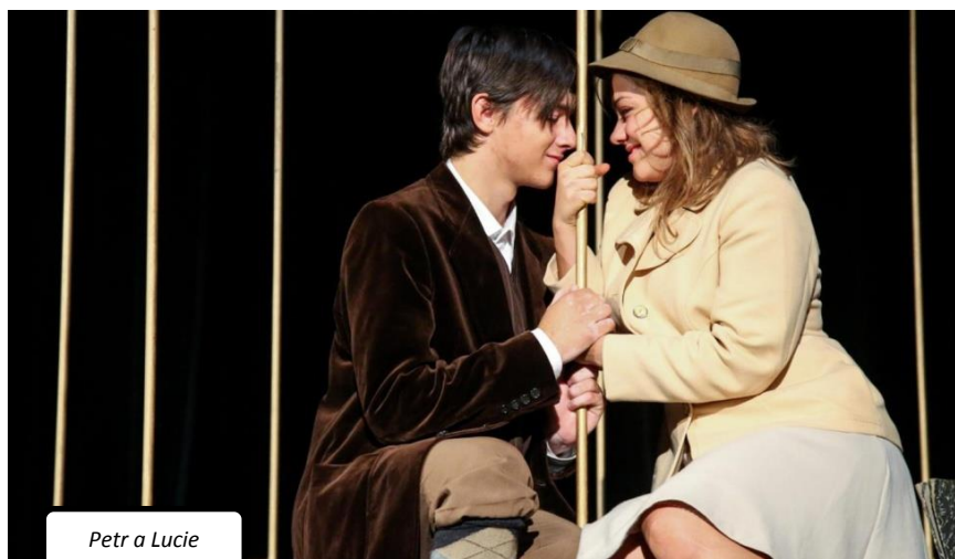
Petr a Lucie

9. třída se 10. 10., tedy v úterý, zúčastnila divadelního přestavení „Petr a Lucie“, které ztvárnilo Divadlo různých jmen. Děj pojednává o dvou zamilovaných mladých lidech, kteří žijí za doby 1. světové války ve Francii, a proto se musí vypořádat s každodenními nálety a rizikem ztráty života, přesto se scházejí. Hra byla velmi krásně zahrána. Celý příběh si můžete buď přečíst v knize „Petr a Lucie“, nebo zajít jako my do divadla.