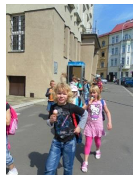
/u městského úřadu/