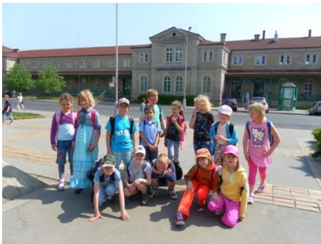
/před budovou hlavního nádraží/

Velkým přínosem pro mě bylo, že se žáci často dostali do míst, kam se běžný občan, málokdy podívá např. zasedací místnost primátora, trezor v knihovně, šatny a posilovna hasičů. Projekt byl velmi pěkný a žáky zaujal.